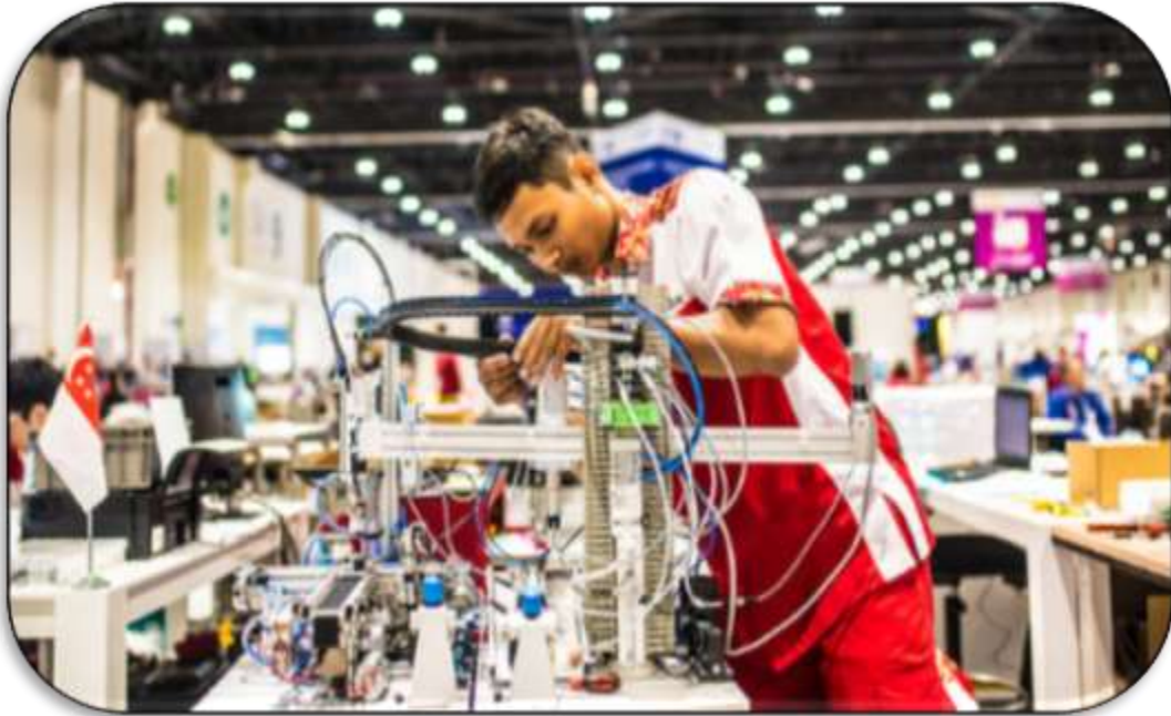
World Skill Competition on October 2017 in Abu Dhabi