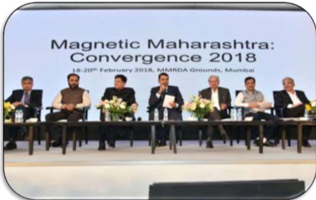
MoU signing during Magnetic Maharashtra 2018 (18-20 th Feb., 2018)