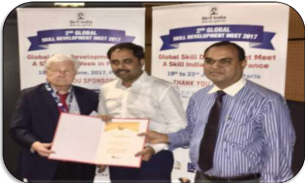
SDED awarded at Global Skill Summit, Paris for encouraging Govt.-Private Sector alliance for modernization of ITIs