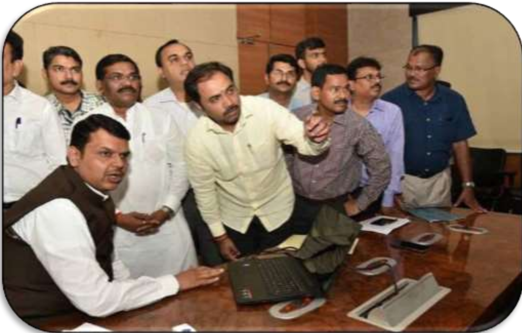
Launch of Mahaswayam Web portal on 30 th May 2017