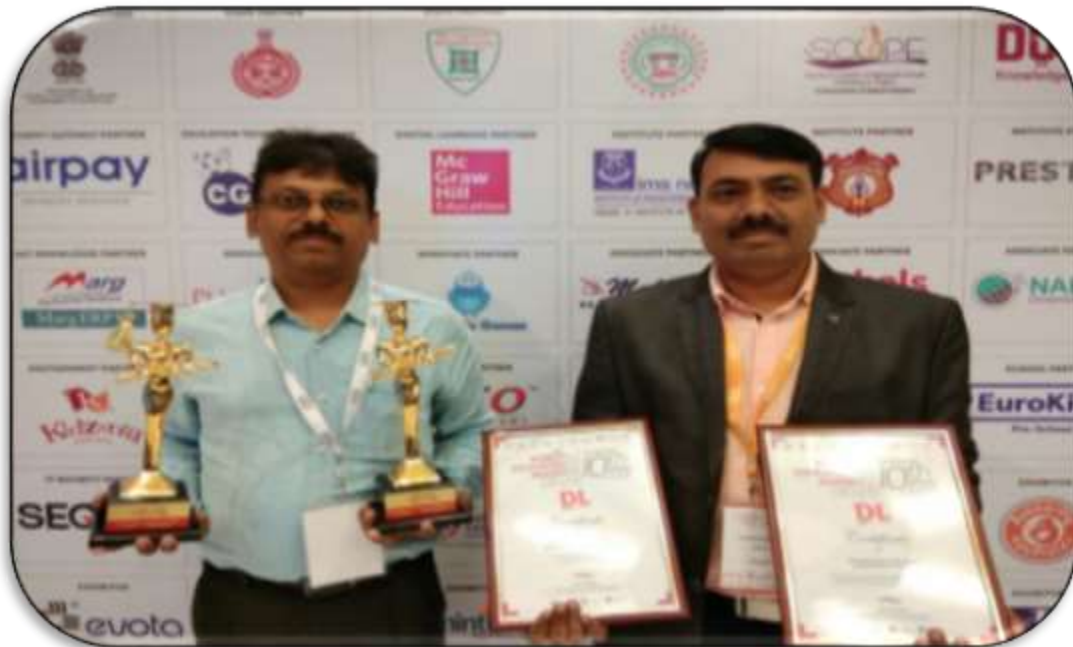
Award for "Best Government sector initiative in skill development" & "Best PPP in the field of Vocational Education & Skill Training" in 10th World Education Summit (11-12 th August, 2017)