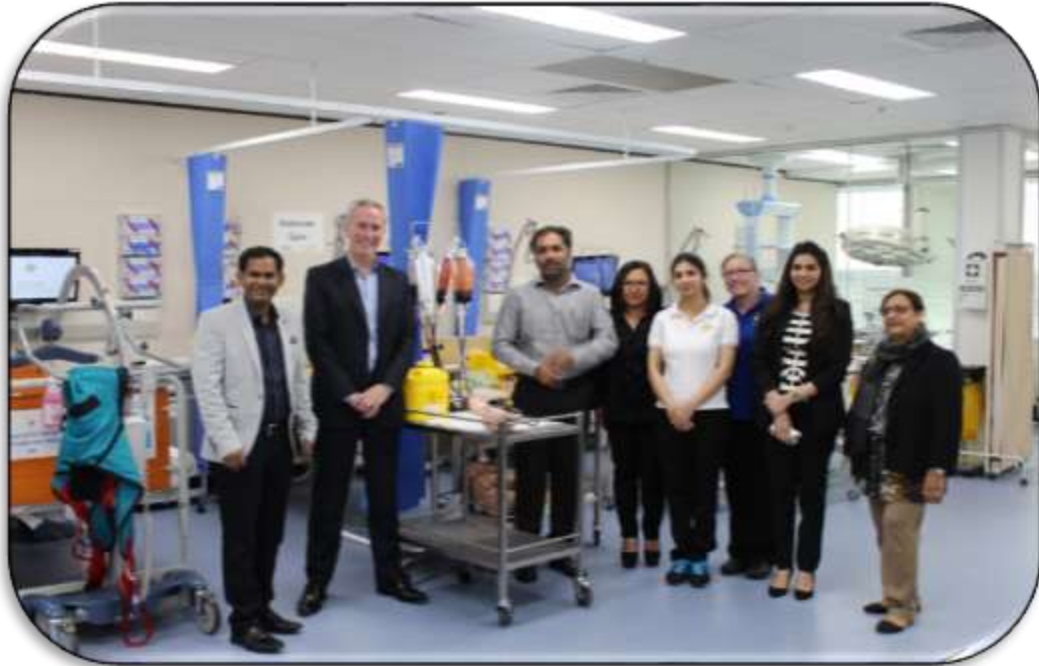
MSSDS visit during November 2017 Australia Visit