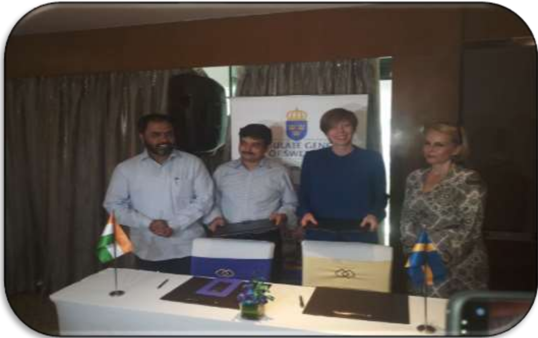
Hon'ble Minister, SDED & Labour and Secretary, SDED MoU signing with Swedish Chambers of Commerce (18 th February, 2018)