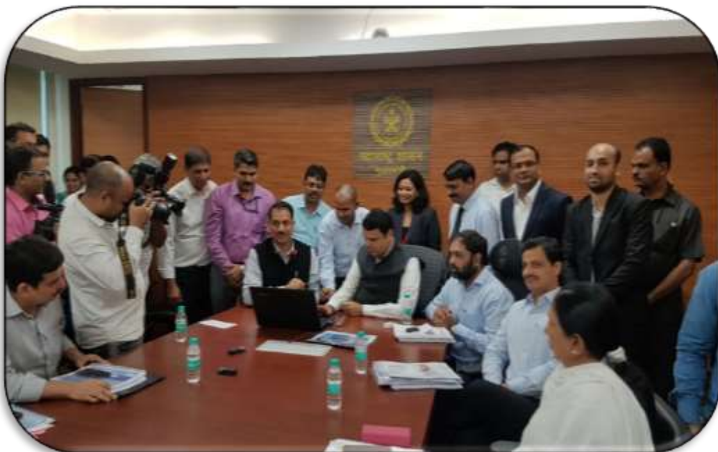
Launch of Skill Calendar on 29 th July 2017